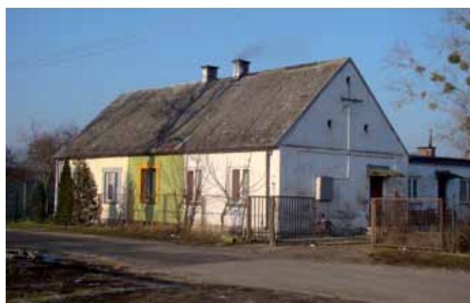
Przebudowany budynek elementarnej szkoły ewangelickiej; fot. K. Zadrożny.