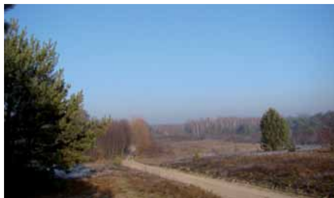
Niecka po nieistniejącym jeziorze Georgenthal, obecnie teren wsi Budy Lucieńskie; fot. K. Zadrożny.