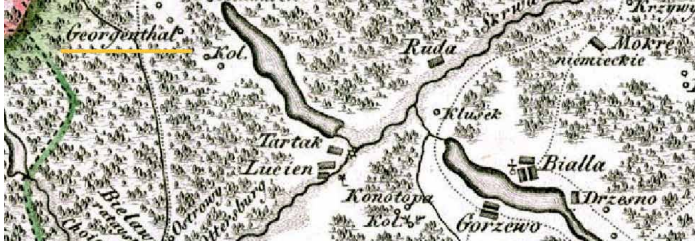
Mapa Prus Południowych Davida Gilly z 1803 r.

mknięto 26 lat później. 8 W 1922 roku ogłoszono obwieszczenie, którym zmieniono nazwę miejscowości na obecnie obowiązującą – Miałkówek. 9