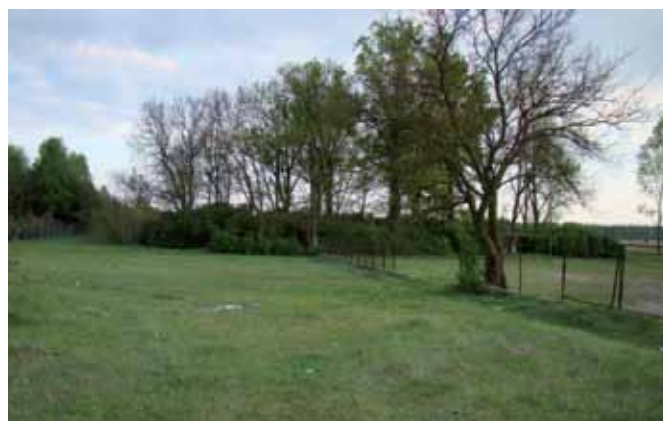
Widok na cmentarz ewangelicki, maj 2011 r.; fot. K. Zadrożny.