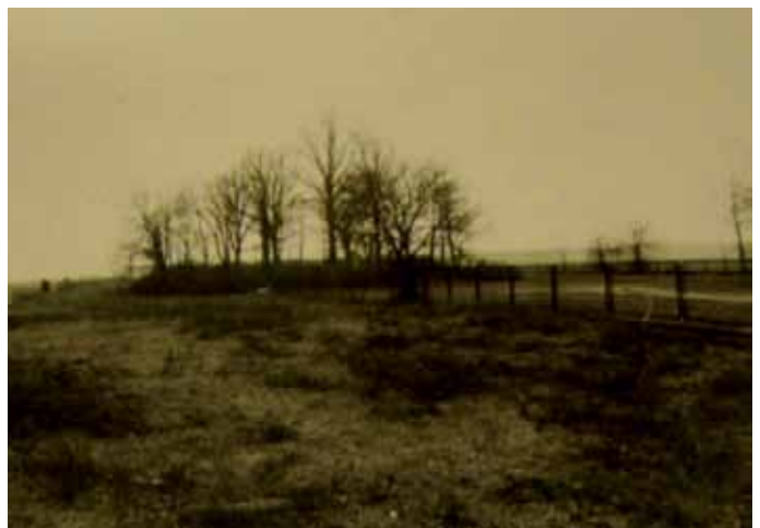
WIDOK OGÓLNY CMENARZA OD STRONY PÓŁNOCNEJ, 1998 ROK