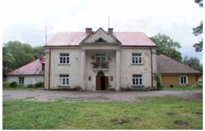
Dwór w Sikorzu – elewacja frontowa, VIII 2013 r.; fot. Z. Miecznikowski.