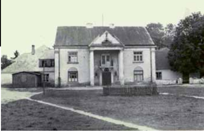
Dwór w Sikorzu – elewacja frontowa, 1959 r.