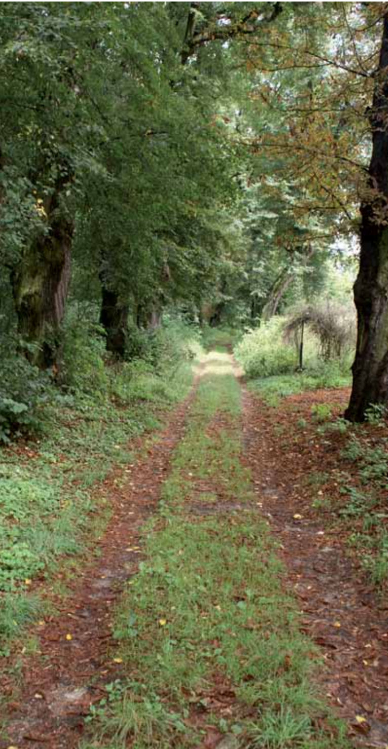
Zabytkowa aleja lipowa prowadząca do dworu w Sikorzu, VIII 2013 r.; fot. Z. Miecznikowski.