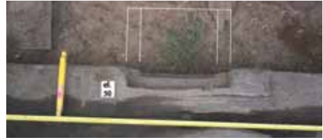
Fot. 7. (autor A. Piasecki).

Brak dokładniejszych badań dendrochronologicznych wyklucza dokładną i bezwzględną datację znaleziska, jednakże na podstawie analizy rozwiązań technicznych można śmiało określić okres budowy i eksploatacji na wiek XIX, a najprawdopodobniej na 1 połowę tego stulecia.