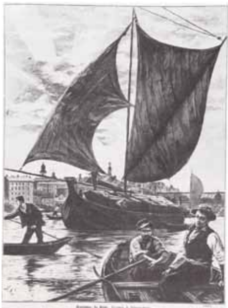
Ryc. 3. Berlinka na Wiśle w Warszawie; drzeworyt ilustracyjny E. Gorazdowskiego z 1881r.

(K. Sroczyńska, J. Jaworska, op. cit. , s. 125).