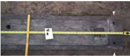
Fot. 4. (autor A. Piasecki).