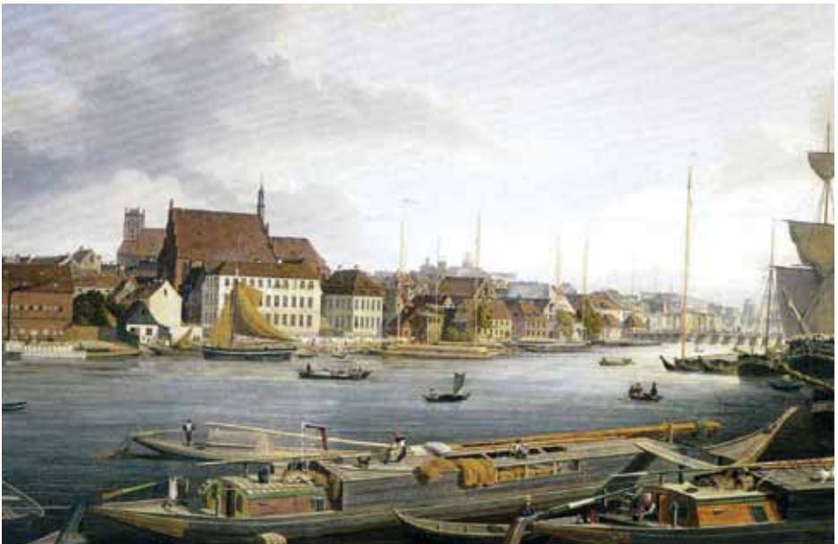
Ryc. 2. Berlinki w porcie szczecińskim; obraz olejny autorstwa L. E. Lüttkego z 1839 r. (M. Czasnoję, op. cit. , s. 17).