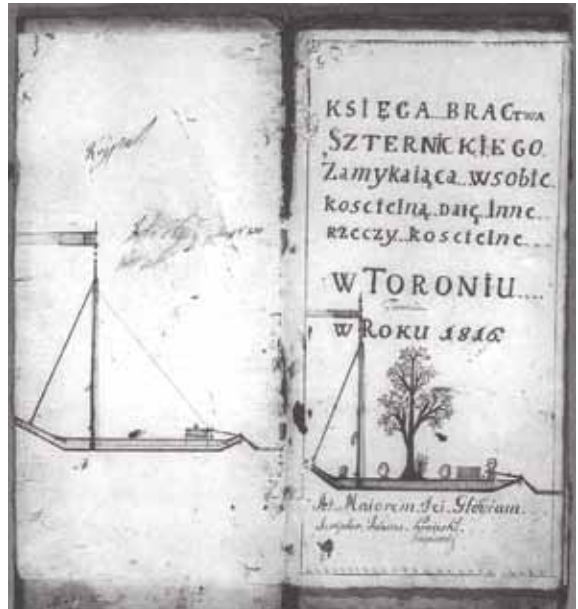
Ryc. 1. Przedstawienie berlinki z 1816 roku (K. Kluczward, op. cit. , s. 170).