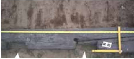
Fot. 6..