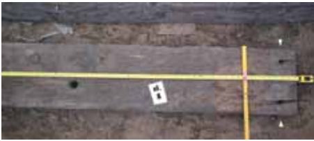
Fot. 3.

padle, co wyklucza zastosowanie łączenia klepek w jeden pas poszycia na tak zwane złącze skośne – mocne efektywne i szeroko stosowane. Może tu chodzić o technikę łączenia klepek jedynie przy zastosowaniu dodatkowego elementu, krótkiej nakładki tzw. „szali”, w tym przypadku jednak brak takiej. Być może funkcje szali spełniał dennik, pod którym były łączone klepki i w który wbijano gwoździe. Ślady po gwoździach w spodniej części dennika zaobserwowano w trzech elementach (13, 17, 53), występują tam parami, naprzeciw siebie, przy obu krawędziach dennika, co może uprawdopodobniać tę tezę (fot. 3, 4, 9).