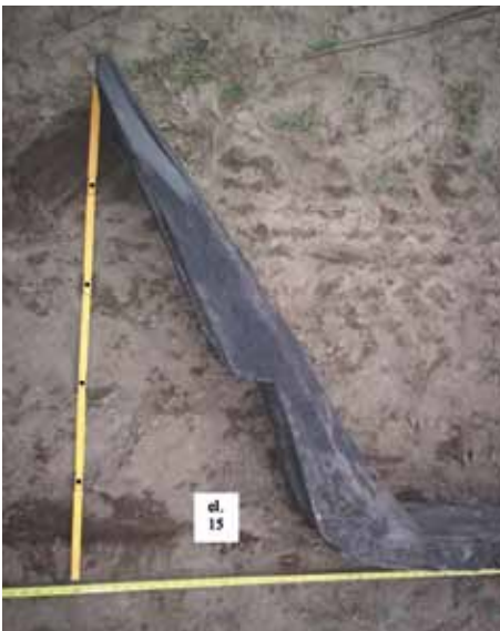
Fot. 5. (autor A. Piasecki).

Do ciekawszych przykładów denników należy zaliczyć elementy 14, 15, 50. W elemencie 15 wykonano 2 prostokątne wręby prawdopodobnie do zamontowania na stałe (świadczą o tym ślady po gwoździach) dwu elementów pionowych (fot. 6). Trudno orzec o ich funkcji, być może stanowiły element konstrukcyjny ściany ładowni lub innego pomieszczenia. W elementach 14 i 50 natomiast wykonano gniazdo masztu (fot. 7, 8). Większa część gniazda masztu wykonana została w elemencie 14, w elemencie 50 wykonano część gniazda jedynie na głębokość 5cm. Gniazdo masztu ma budowę stopniową, pierwszy stopień o prostokątnym rzucie ma wymiary 38 na 26cm i zagłębiony jest w denniku na 5cm. Drugi stopień o głębokości 7cm ma wymiary 28 na 22cm. Prawdopodobnie wymiary stopnia drugiego (lub nieco mniejsze) odpowiadają wymiarom piąty masztu.