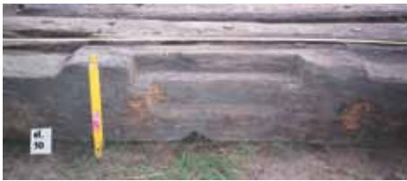
Fot. 8. (autor A. Piasecki).