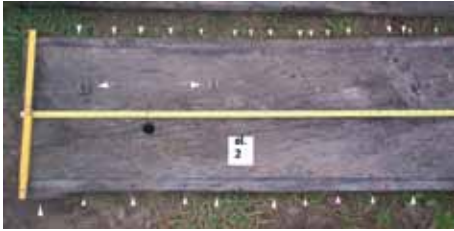
Fot. 1. (autor A. Piasecki).

wręgi z klepkami poszycia burtowego gwoździ, w górnej partii burty wbijany od wewnątrz (el. 13, 14, 15), w dolnej zaś prawdopodobnie od zewnątrz (el. 16, 17). Burtowe pasy poszycia były co najmniej 2 lub, co bardziej prawdopodobne, 3 (analogicznie we wraku z Krosna Odrzańskiego) 15 . Wręg posiadał w części przydennej tylko jeden zacios na przyjęcie klepki pierwszego pasa poszycia, który z pasem nr 2 złączony był na zakładkę. Trzeci (relingowy) pas poszycia połączony był z pasem drugim na styk. Obserwacja w zakresie konstrukcji burty była utrudniona z powodu zwięzienia wielu wręgów (el. 13, 14, 16, 46, 48, 49, 50, 51). Elementy usztywnienia poprzecznego montowano parami ściśle przylegającymi do siebie, o czym świadczą