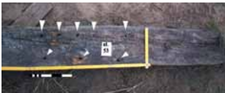
Fot. 9. (autor A. Piasecki).

Biorąc pod uwagę w miarę dobry stan zachowania szczątków statku z Dębeo oraz unikatowość znaleziska, być może powinno się zastanowić nad dalszymi losami tego zabytku. Ciekawą formą jego prezentacji mogłaby być ekspozycja na terenie muzeum uzupełniona rekonstrukcją pozostałych elementów wraku. Za takim rozwiązaniem przemawiałyby niewielkie koszty rekonstrukcji, możliwości wystawiennicze muzeum