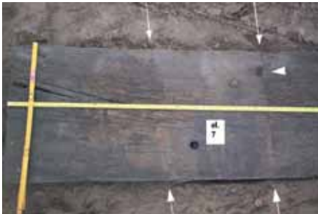
Fot. 2.

wręgi z klepkami poszycia burtowego gwoździ, w górnej partii burty wbijany od wewnątrz (el. 13, 14, 15), w dolnej zaś prawdopodobnie od zewnątrz (el. 16, 17). Burtowe pasy poszycia były co najmniej 2 lub, co bardziej prawdopodobne, 3 (analogicznie we wraku z Krosna Odrzańskiego) 15 . Wręg posiadał w części przydennej tylko jeden zacios na przyjęcie klepki pierwszego pasa poszycia, który z pasem nr 2 złączony był na zakładkę. Trzeci (relingowy) pas poszycia połączony był z pasem drugim na styk. Obserwacja w zakresie konstrukcji burty była utrudniona z powodu zwięzienia wielu wręgów (el. 13, 14, 16, 46, 48, 49, 50, 51). Elementy usztywnienia poprzecznego montowano parami ściśle przylegającymi do siebie, o czym świadczą